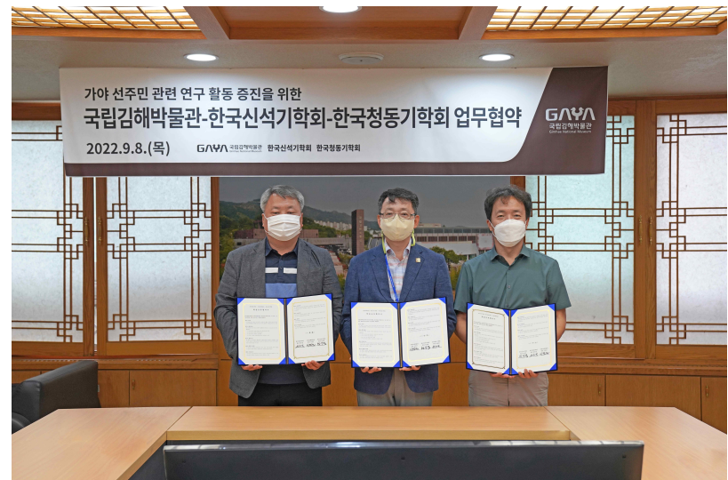
국립김해박물관-한국신석기학회-한국청동기학회 협약식 2022.9.8.