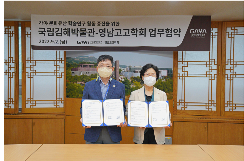
국립김해박물관-영남고고학회 협약식 2022.9.2.