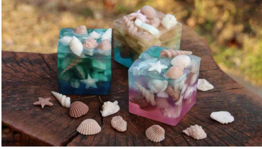
특별전 연계 교육 '조개를 품은 패총' - 패총비누