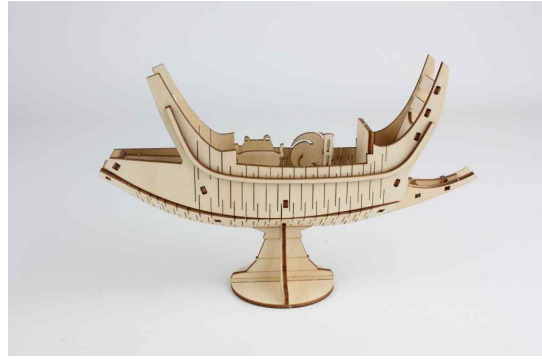
특별전 연계 교육 '가야의 배를 타고~ 둥둥!' - 가야의 배 입체퍼즐