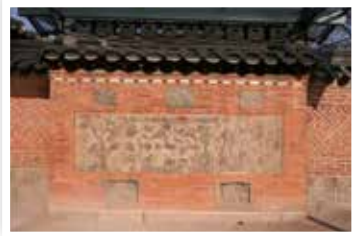
그림 2 | 경복궁 자경전 골돌 담장