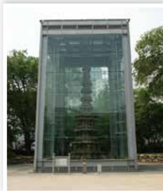
그림 4 | 원각사지 10층석탑 보존각