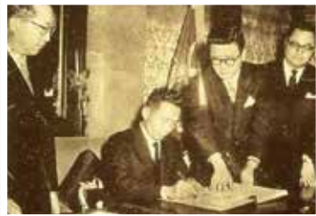
그림 5 | 1963년 한일기본협정 체결