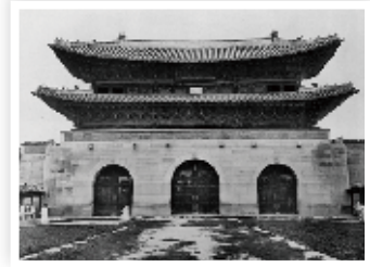
그림 3 | 1900년대 경복궁 광화문