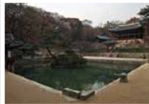
그림 1 | 세계문화유산 창덕궁 후원