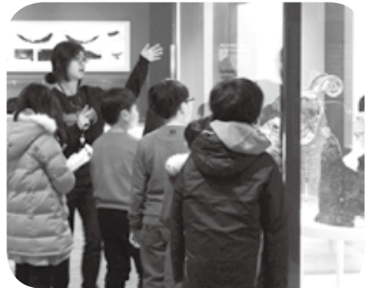
아이언맨! 가야를 지켜줘