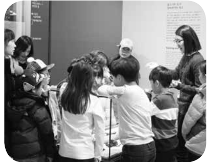
무한항해! 글로벌 가야!