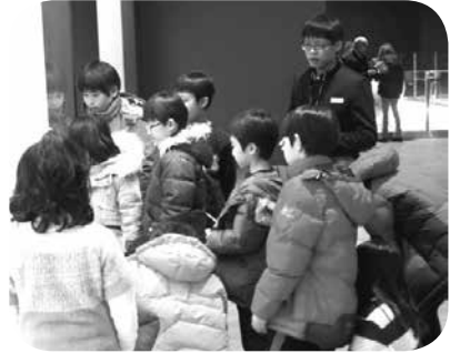
1박 2일 가야에서 살아남기