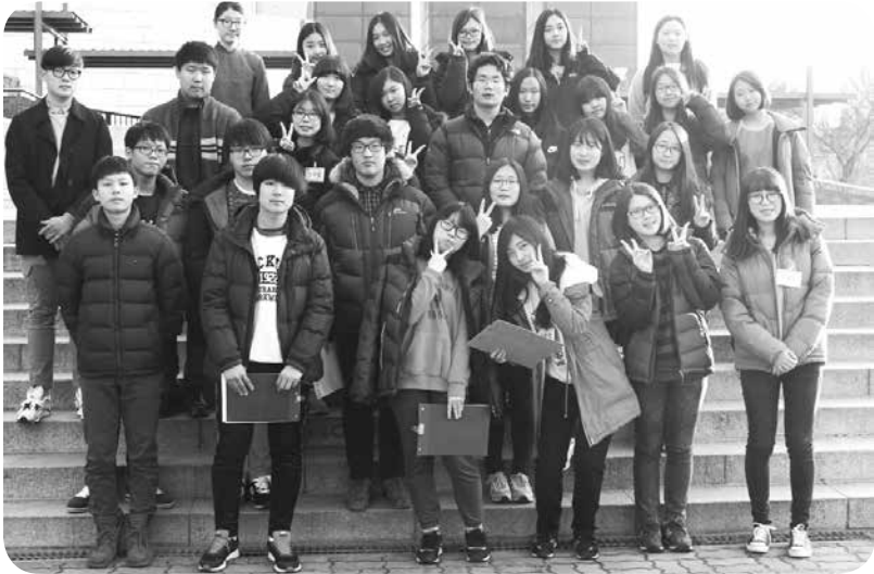
"제6기 우리들의 행복한 박물관-나는 도슨트!"