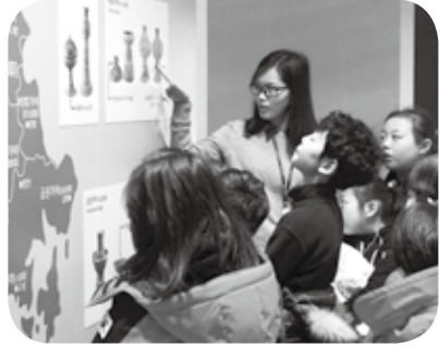
흙그릇, made in 가야