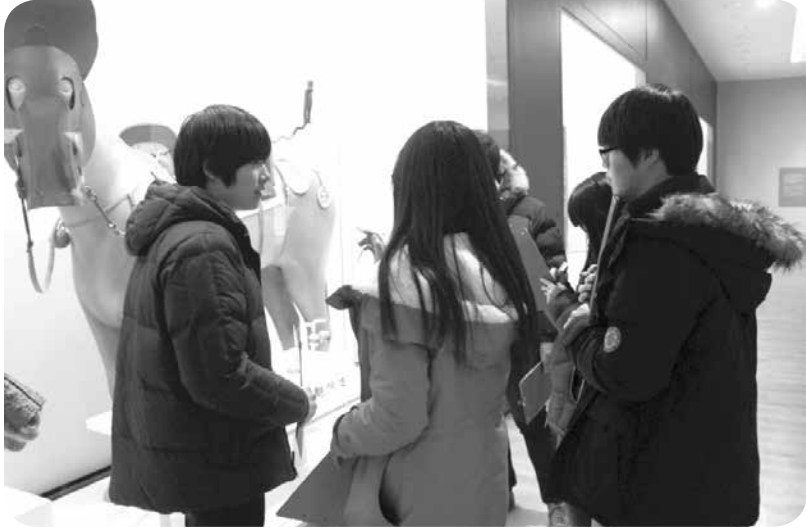
문화재 조사 및 스크립트 작성