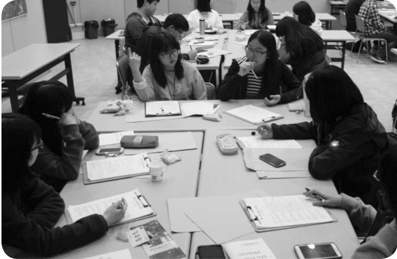
모듬활동(주제선정 및 스토리 보드작성)