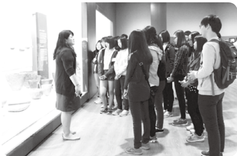
박물관 전시해설사와 만남