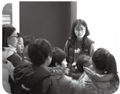
타임머신 타고 무덤 속으로