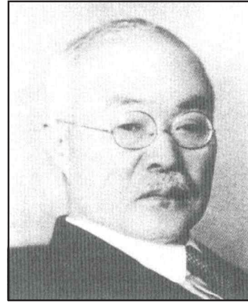
<그림 1> 세키노 타다시(關野貞)

개인이 중심이 된 조사였다. 1909년에 최초로 굴착·조사된 석암동 고분은 세키노가 평양지역을 답사 여행하는 과정에서 현지 거류 일본인의 정보 제공으로 이루어졌으며 보존상태가 가장 양호한 고분을 골라 즉석에서 굴착조사가 이루어졌다. 물론 한국정부에 조사와 관련된 사전 통지를 하고 허가 절차를 거쳤다는 그 어떠한 형적도 확인되지 않는다.